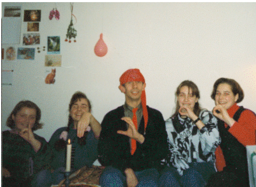
Viipekeelehuviliste jõulupidu 1994, detsember. Ühiselt sõrmendatav sõna- EESTI.

Ameerika Ühendriikides on näiteks enam kui 200 kurtide klubi, kus inimesed kohtuvad enamasti nädalalõppudel ühiseks ajaveetmiseks, ärikohtumisteks, õpikodades või loengutel osalemiseks, subtiitritega filmide vaatamiseks, mängimiseks, kaaslaste otsimiseks, sünnipäevade tähistamiseks ning naljade, anekdootide ja isiklike läbielamiste jutustamiseks. Samuti toimuvad paljudes kurtide klubides üks või kaks korda nädalas jalgpalli-, korvpalli-, golfi- ja muude spordialade treeningud ning võistlused. Suures linnas on enamasti rohkem kui üks kurtide klubi; näiteks Washington DC-is on kolm klubi, Philadelphias kaks ja New Yorgi suurlinnas rohkem kui kolmkümmend viis klubi. See viitab erineva isikulise, haridusliku ja elukutselise tagapõhjaga inimeste kultuurilisele mitmekesisusele kurtide kogukonnas (Carmel 1996, 198).